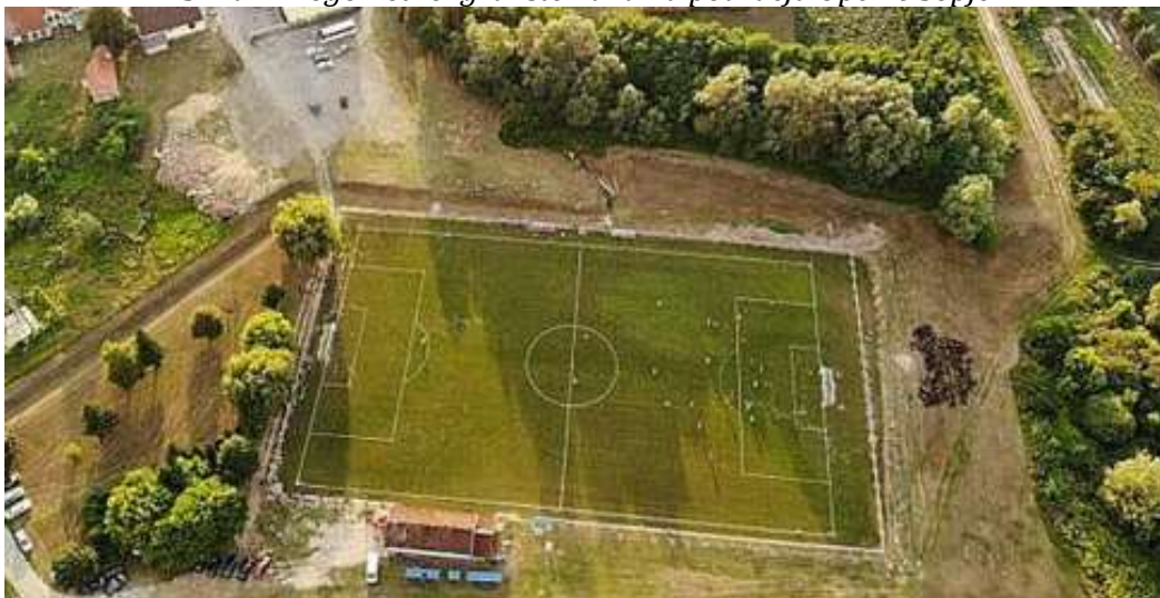
Slika 1. Nogometno igralište Luka na području Općine Sopje

Općina Sopje donijela je Odluku o načinu upravljanja i korištenja sportskih građevina u svom vlasništvu. Odlukom je utvrđeno kako se javne sportske građevine u vlasništvu Općine koriste za zadovoljavanje javnih potreba u sportu. Poslovi upravljanja sportskim građevinama, između ostalog, obuhvaćaju redovito tekuće i investicijsko održavanje sportske građevine te kontrolu korištenja sportske građevine u skladu sa zaključenim ugovorima. Nadalje, Odlukom je utvrđeno da se načini i uvjeti upravljanja sportskim građevinama utvrđuju ugovorom o upravljanju i korištenju sportske građevine te da se sportske građevine daju na korištenje sportskim udrugama bez naknade. Korisnici sportske građevine obvezni su podmiriti troškove električne energije i vode, komunalnih usluga, administrativnih i knjigovodstvenih poslova, premija osiguranja te redovitog održavanja kojima se sportska građevina održava u funkcionalnom stanju. Općina Sopje je na temelju donesene Odluke s nogometnim klubovima zaključila ugovore o korištenju nogometnih igrališta u njihovom vlasništvu bez naknade.